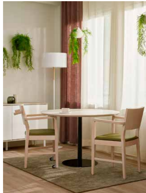
Junet Oy toimitti kalusteet ja sisustustuotteet Karkkilassa toimivaan ikäihmisten Hoivamme-kotiin.