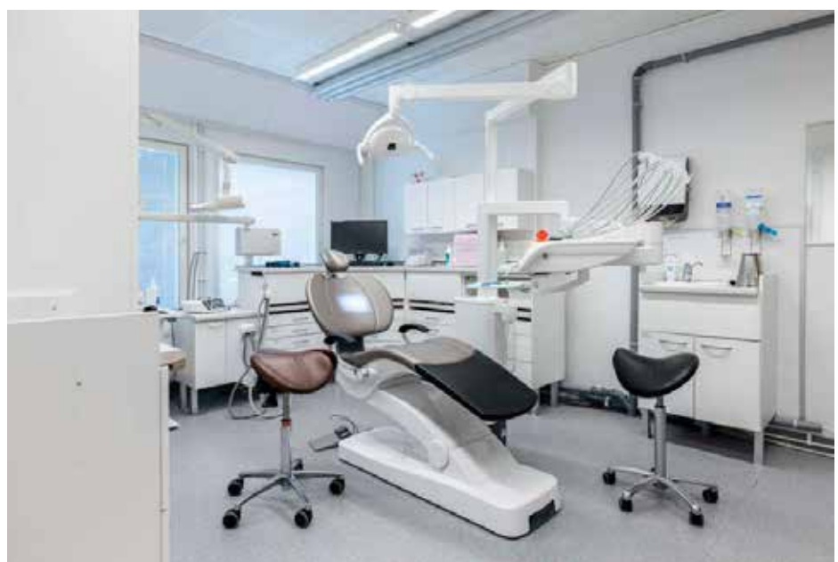
Kuntien ja hyvinvointialueiden tilatarpeet voivat tuntua vaativalta palapeliltä koottavaksi. Nastolan sote-keskuksen palvelut pystyttiin siirtämään sujuvasti viihtyisiin väistötiloihin ilman palvelukatkoja.