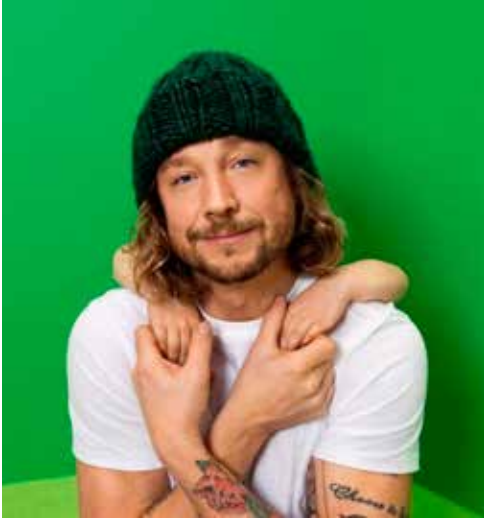
Artisti ja biointerpreetti Samu Haber on vuoden 2024 Mielinauha-kasvo.

Jokakeväsellä Mielinauha-kampanjalla (tänä vuonna 3.4.-30.6.) halutaan lisätä puhetta mielen-terveydestä ja kerätään varoja mielen-terveytyölle ja kriisiauttamiselle Suomessa. Maailman kriisien ja taloudellisen tilanteen myötä erityisesti kriisityön ja nuorten mielen-terveytyön tarve on kasvanut.