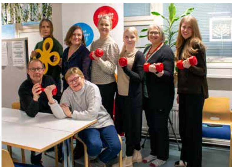
Pohjois-Savon Muisti ry kehittää työtään yhteisöohjautuvaksi.

– Tuolloin yhteisöohjautuvuuteen perehtyessämme tutustuimme myös hollantilaiseen Buurtzorgin kotihoitoyritykseen, joka on edelläkävijä yhteisöohjautuvuuden hyödyntämisessä.