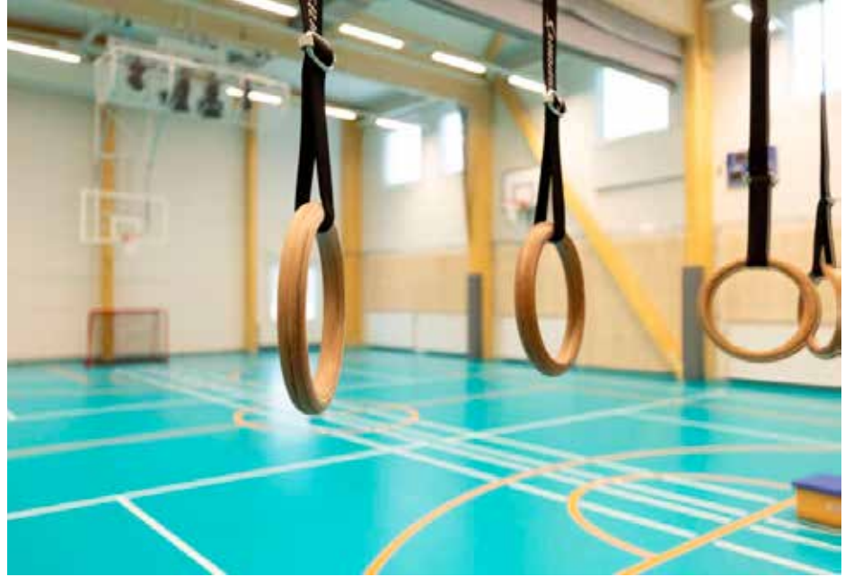
Vantaan Kytöpuiston koulun väistötilaan Adapteo toteutti muun muassa täysimittaiset liikuntatilat.

– Moduulirakenteisissa projekteissa kestävän kehityksen ja kiertotalouden periaatteet toteutuvat; rakenteet on tehty puusta, kaikki jätteet kierrätetään ja itse rakennukset on varta vasten suunniteltu uudelleenkäytettäväksi. Vuokra-ajan jälkeen rakennus on mahdollista purkaa ja siirtää muualle uuteen käyttöön.