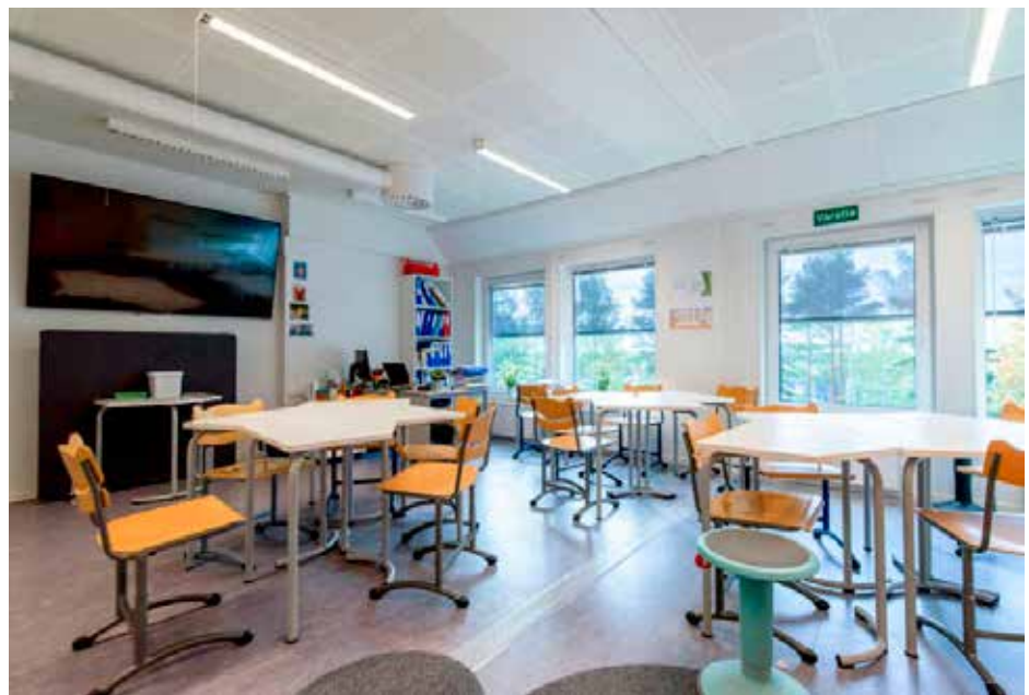
Lahdessa Tiirismaan koulua on käyty useita vuosia siirtokelpoisissa tiloissa, ja nyt koulun moduulit on siirretty ja kunnostettu uuteen käyttötarkoitukseen.