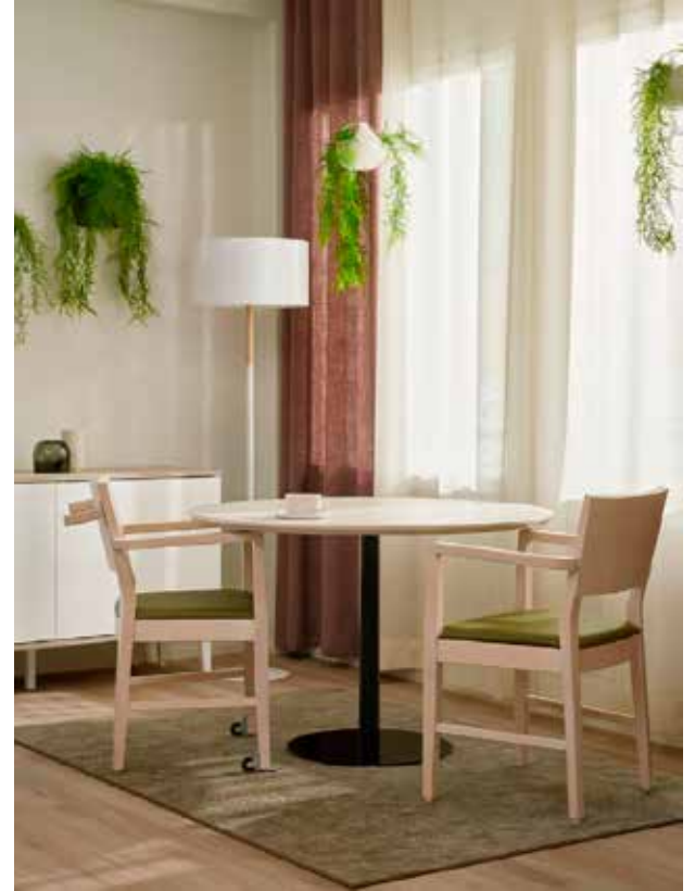
Junet Oy toimitti kalusteet ja sisustustuotteet Karkkilassa toimivaan ikäihmisten Hoivamme-kotiin.